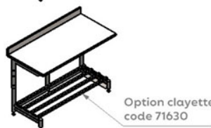
Option clayette code 71630